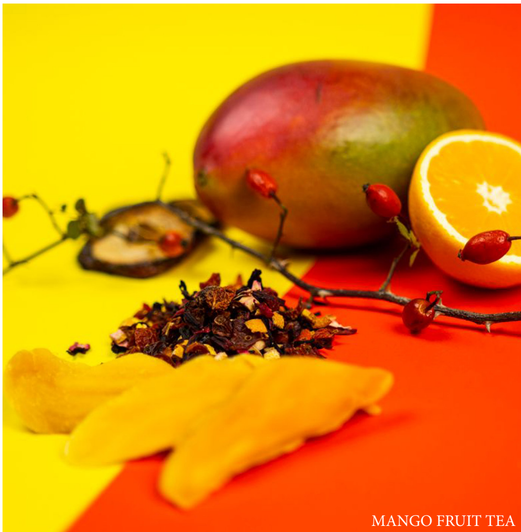
MANGO FRUIT TEA

Susz truskawkowy, kiwi, owoc dzikiej róży i suszone jabłuszko tworzą egzotyczną mieszankę o niesamowitej barwie.